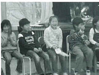
初めてのアニマシオン体験

② 小学校 学年行事に参加された保護者の方から「今日は、公共図書館に行きます。」「子どもと本を読んでみます。」