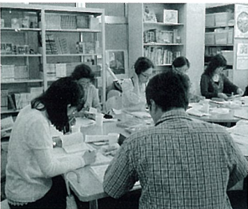
アニメーション講師養成講座 (8月22日協会事務所にて)