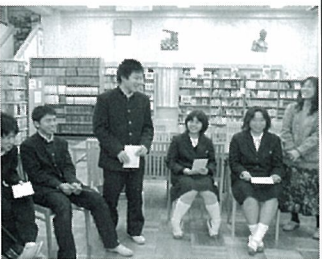
図書館イベントに参加した高校生

も話してよい雰囲気をつくり、ひとりで静かに考える時間を大切に、子どもの発言・態度をそのまま受け入れます。あくまで、自発性と静かに考える時間を重んじます。そうして、子どもの読書する力を引き出します。