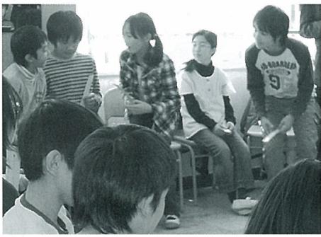
学級でのアニマシオン実施風景

次に予読を必要とする作戦に挑戦しました。区の公共図書館の団体貸出制度を利用し、二人に一冊本が行き渡るように準備しました。クラス