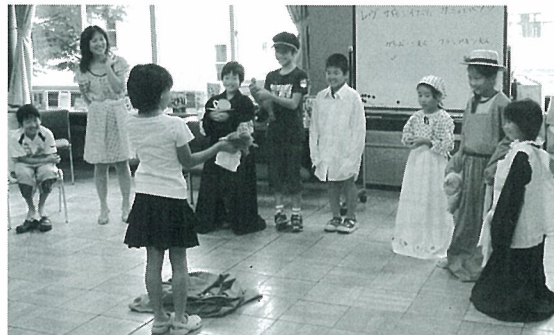
「親子図書館たんけん」でのアニメーション (編集部)

読書教育の中でアニメーションが求められ、広く取り入れられている事を励みに、ますますアニメーション普及のために努めたいと感じております。