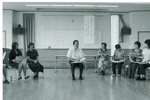
児玉郡本庄市学校図書館教育研修会 (8月5日上里町女性センターにて)